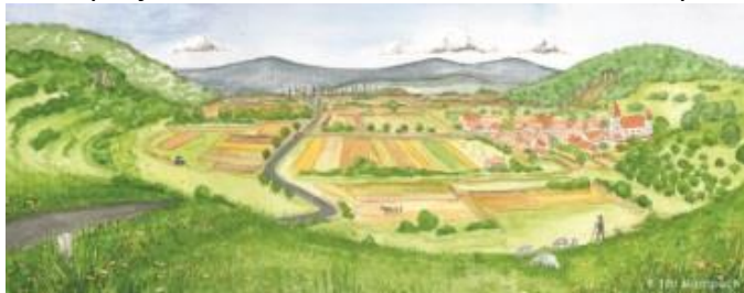
A nagy kérdés: miként fog ez a táj megváltozni?

A multidiszciplináris kutatócsoport helyi szervezetek, intézmények, gazdálkodók, iskolák, egyházak, a helyi etnikumok képviselői bevonásával a jövőképtervezés (scenario planning) módszerét alkalmazta, elbeszélgettek a helyiekkel a lehetőségekről, tervekről, ily módon körvonalazódott a négy jövőkép, amely vizuálisan is összehasonlítható. A projektet az Alexander von Humboldt alapítvány finanszírozza.